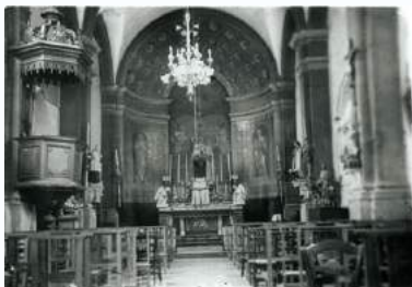
Le choeur de l'église en 1937

Deux magnins [artisans ambulants] s'arrêtant au domicile des Barbe à Novillars, sont fraîchement accueillis pour avoir mal châtré un verrat qui a crevé depuis leur dernier passage. Une dispute s'ensuit. On en vient aux mains, la population du village (à peine plus de deux dizaines d'habitants) excitée, poursuit à travers champs les deux magnins, jusqu'à Roche. Ceux-ci, affolés, ne trouvent leur salut qu'en se réfugiant dans la nef de l'église, au milieu d'un office!