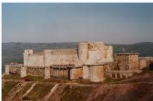
Krak des Chevaliers