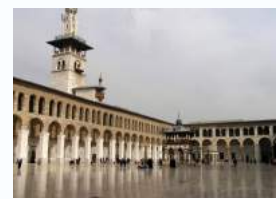
Mosquée de Damas

Retrouvez les résumés et les galeries de photos des expositions et des animations mensuelles sur le blog bibliothequeroche.overblog.com