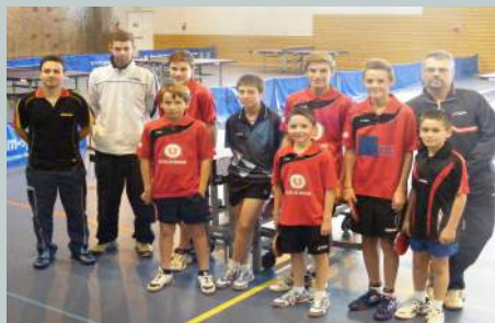
Les sept jeunes pongistes rochois et les animateurs du stage régional de Vesoul.

A noter enfin un rendez-vous à ne pas manquer : les amateurs de ping pong sont invités à venir supporter l'équipe phare du club qui évolue en pré nationale et rencontrera à domicile ( salle Lumière) l'US Forbach le samedi 13 décembre prochain à 17h.