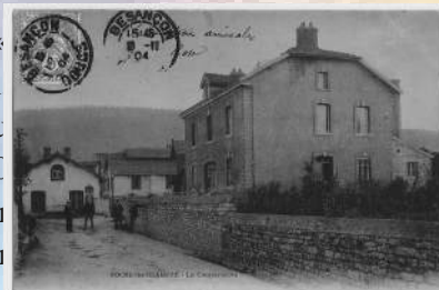
Rue de l'Usine à la Gare en 1904 (actuelle rue d'Arcier)– A droite, la Coopérative ; au centre, les bâtiments de l'usine Bugnot-Colladon

Le nom de ce chemin de défruit qui part du bas de la Vie d'Aucourt, n'est pas bien arrêté puisque lors de l'établissement du nouveau cimetière en 1877, il s'avère nécessaire de transformer le chemin de défruit dit « de Laumènne » en chemin vicinal alors baptisé « chemin du Cimetière » sur une longueur de 316 m. Ce chemin sera élargi de deux mètres sur décision du 10 février 1883 par l'achat de terrain sur environ 80 m de longueur (à 2 F le m 2 ), somme remboursée par l'usine Bugnot-Colladon qui sera autorisée à établir « une voie de fer » de 40 cm de large sur l'un des côtés du chemin.