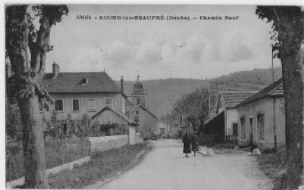
Le chemin Neuf (rue de l'Eglise) A droite, le lavoir, précédé du pont à bascule (1899)