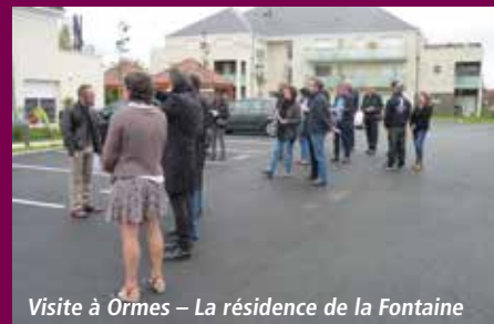
Visite à Ormes – La résidence de la Fontaine

Les remarques et propositions ont été formalisées dans un rapport remis au Comité de pilotage de la ZAC. Les élus et EXIA examinent la faisabilité des demandes afin de préciser et adapter le schéma d'aménagement en vue de l'exposition et de la réunion publique.