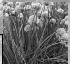
Le massif des Aromates : Goûter

« de l'émerveillement à la responsabilisation... »