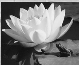
La mare frémissante : Écouter

Atelier : à l'écoute des sons de la nature Supports : CD (chants d'animaux, bruits d'eau), appeaux, objets musicaux