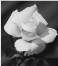
Le massif des senteurs : Sentir

Atelier : identifier et classer les senteurs Supports : jeu des parfums